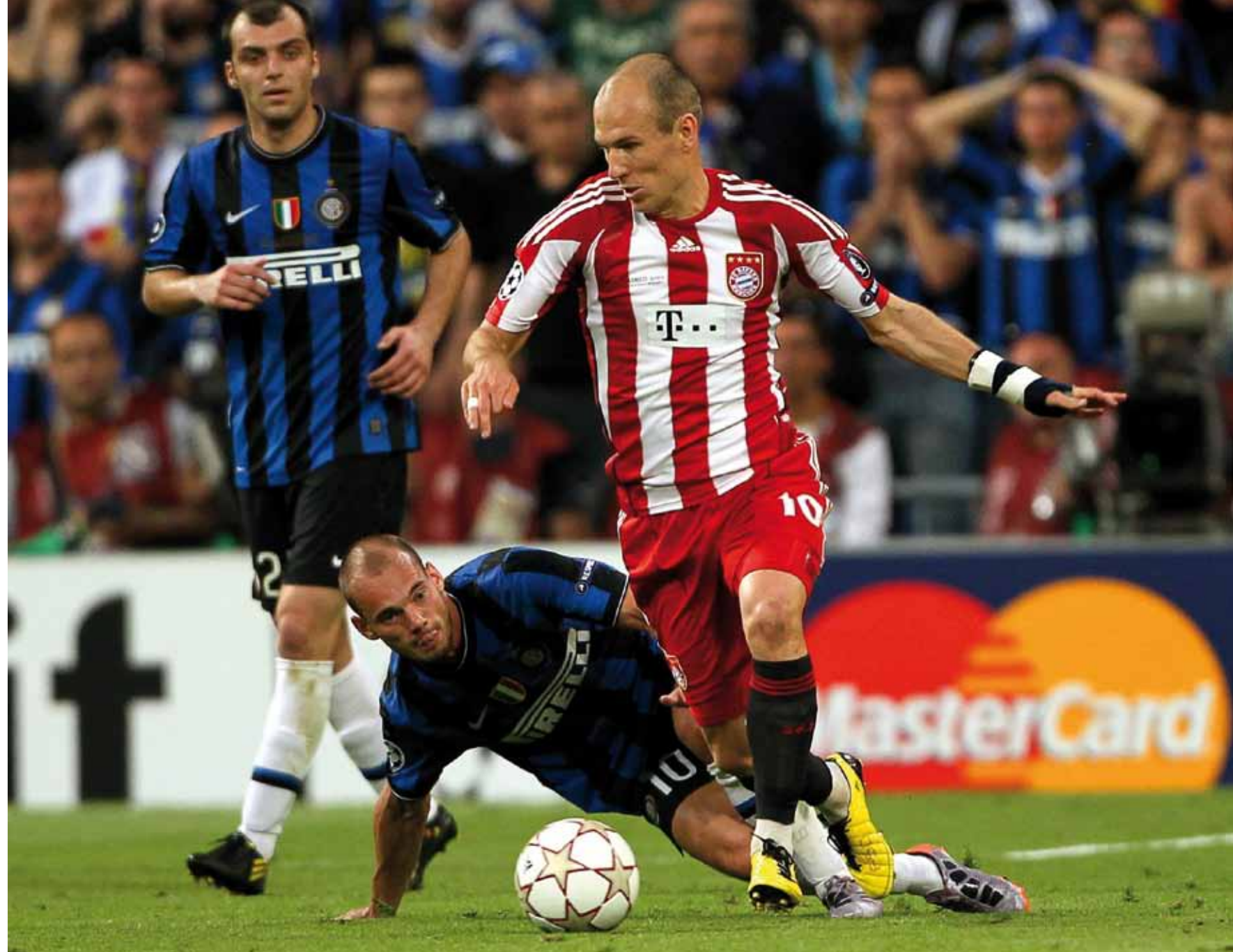
Wesley Sneijder over zijn overtreding op Robben: "Ik hield me in, er schiet dan toch door je hoofd dat we samen ook nog een WK te spelen hebben."